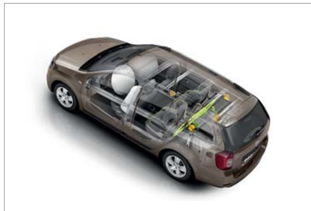
Bescherming: versterkte structuur, frontale en zijdelingse airbags vooraan, Isofix-bevestigingssysteem voor een kinderstoel op de buitenste plaatsen achterin.