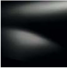
ZWART NACRE (676)