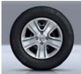
15" SIERWIELDOPPEN POPSTER