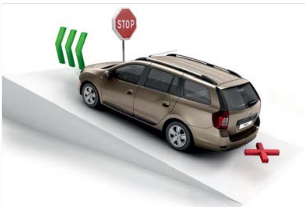
Vertrekhulp op hellingen: dit systeem helpt u in alle veiligheid en rustig te vertrekken op een helling.