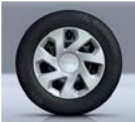
15" SIERWIELDOPPEN GROOMY