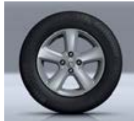
15" LICHTMETALEN VELGEN CHAMADE